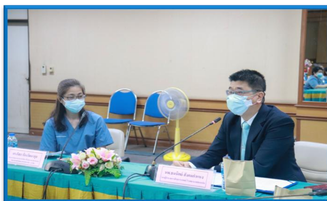
รูปภาพกิจกรรม วันที่ ๗ เมษายน ๒๕๖๕